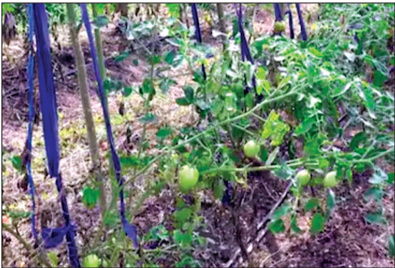
किसानों को कम लागत में मिल रहे अच्छे परिणाम

संस्था के निरीक्षक इस बात की पुष्टि करते हैं कि किसान द्वारा अपने खेत में फसल पैदा करने के लिए पूरी तरह से जैविक खाद, जैविक