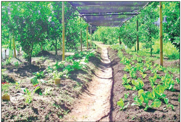
एक दशक बाद फिर बढ़ रहा जैविक खेती की ओर रुझान

यदि कोई किसान जैविक खेती शुरू करता है तो उसके प्रमाणीकरण के लिए मप्र राज्य जैविक खेती प्रमाणीकरण संस्था का गठन किया गया है। इसमें किसान को जैविक खेती शुरू